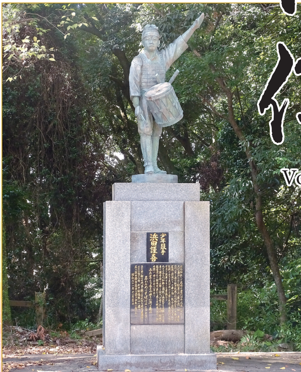
少年鼓手・濱田勤吾の像