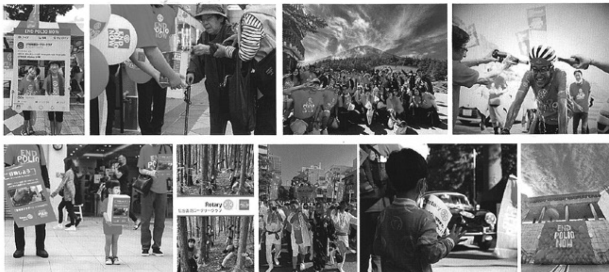
2022-23年度、2023-24年度フォトコンテスト応募作品から