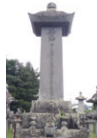
22代(4代藩主) 純長公墓

参考資料・大村史談会発行、大村史談 33号(昭和63年10月)・大村市史第3号・写真集大村文責森本英敏