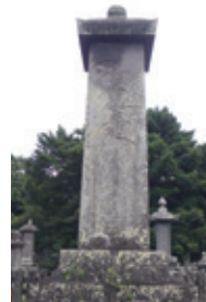
21代(3代藩主) 純信公墓