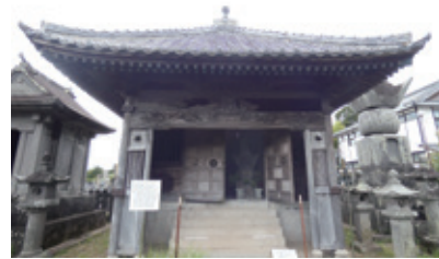
19代(初代藩主) 喜前公墓

墓域は約2,000坪の広さの中に、藩主の墓13基、正室側室16基、一族39基、家臣6基、法華塔4基の計78基それに各墓所に奉獻された石灯籠481基の総計551基が林立しています。特に6mを超える棹石塔(傘塔婆)は、近くを通る長崎街道から白漆喰の百間堀越しに目にすることで、往来の人々に巨大な仏塔を通して藩主の権威と藩挙げて仏教崇拝の姿勢を誇示したものと思われます。特に大村藩3代藩主大村家21代の大村純信 すみなが の6.1mを超える棹石塔(傘塔婆)や、大村藩4代藩主大村家22代大村純長の6.5mを超える棹石塔形式の石塔は圧巻である。