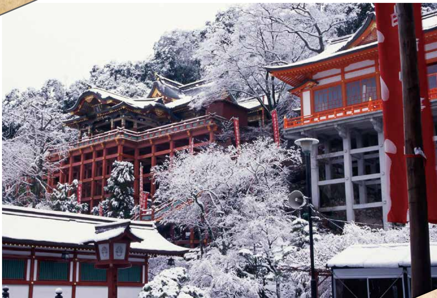
「雪の祐徳稲荷神社」