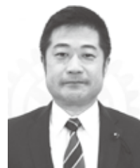
神埼 RC 古川 裕紀 君 佐賀県議会 県議会議員