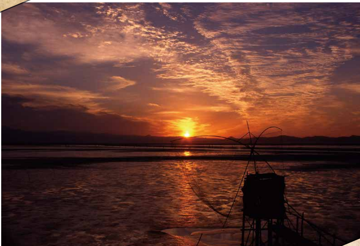
「有明海からの日の出と棚じぶ」