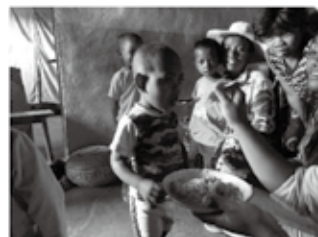
試食する最初の一口。

お米のおかゆは朝ごはんなどでもよく食べられているようですが、パンのおかゆは珍しかったようでした。出来上がったら、調理をしたお母さんの子供たちへ試食してもらいました。初めて見るものなので、警戒して食べない子が1人いましたが、食べた子供たちはお代わりにくるなど、おいしかったようで、ほっとしました。