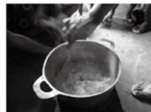
出来上がったパン粥です。

材料はマダガスカルで良く食べられているフランスパンと豆乳、バナナ、サツマイモです。まずは、サツマイモをやわらかくゆでておき、バナナと一緒につぶします。そして、鍋で温めた豆乳に細かくちぎったフランスパンとつぶしたバナナ、サツマイモを入れて、全体的に良く混ぜ合わせたら完成です！