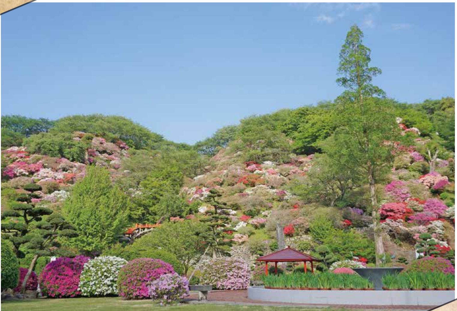
祐徳稲荷神社外苑「東山公園」のツツジ